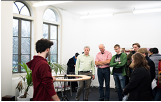
Atelier impressie Feng Chen.

Er was veel belangstelling bij de rondleidingen door art mediators . Met dit jaar tours zoals een crash course kunst kijken, een filosofie rondleiding en een senses tour: een zinnenprikkelende tour die alle zintuigen op scherp zet aan de hand van het werk van verschillende kunstenaars. De art mediators hebben een masterclass gevolgd die de Rijksakademie heeft aangeboden aan jonge professionals die werkzaam zijn in museumeducatie. Hierin werd ingezoomd op manieren hoe je met publiek in gesprek kan gaan over hedendaagse kunst.