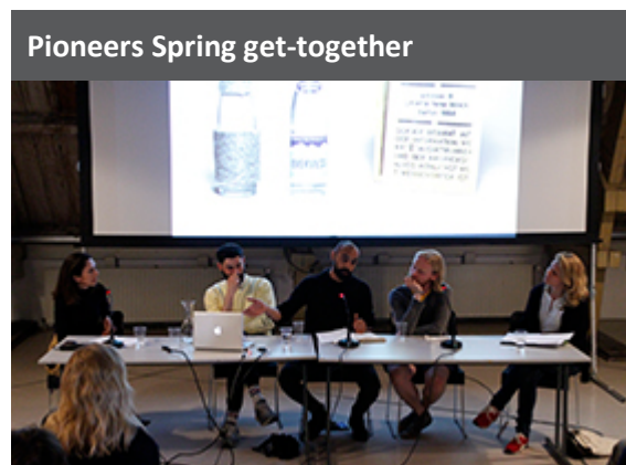
Pioneers Spring get-together

De selectie voor 2016 is volop in gang. Rond 1300 kunstenaars hebben zich aangemeld. Na het bekijken en bespreken van de aanmeldingen worden circa 70 kandidaten uitgenodigd voor een interview. Begin juli is bekend welke kunstenaars zijn geselecteerd voor het residencyjaar 2016.