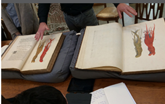
Presentatie boekencollectie Artis