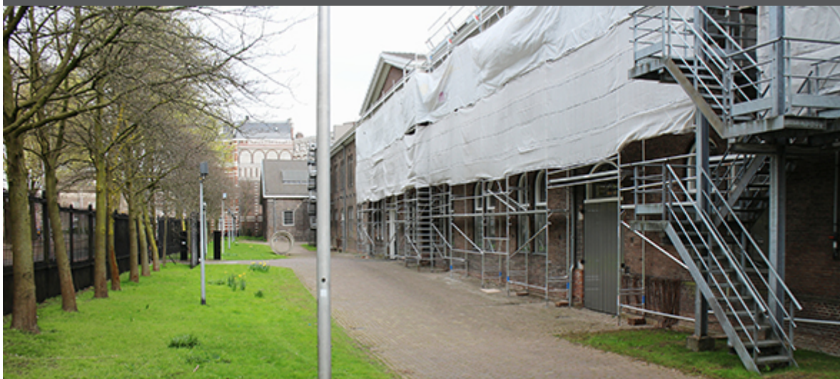
Rijksakademie in de steigers

De Rijksakademie staat in de steigers . Muurankers worden vervangen, kozijnen en goten weer helemaal in orde gebracht. Voor de zomer zijn de restauratie werkzaamheden aan de buitenzijde van de Kavallerie-Kazerne klaar. Volgend jaar gaat de Rijksakademie op de binnenplaats aan de slag.