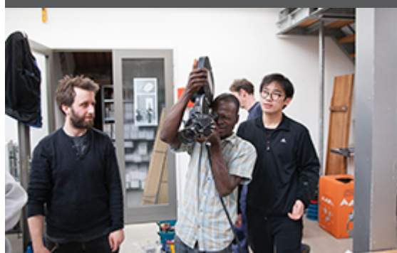
Workshop 16 mm film