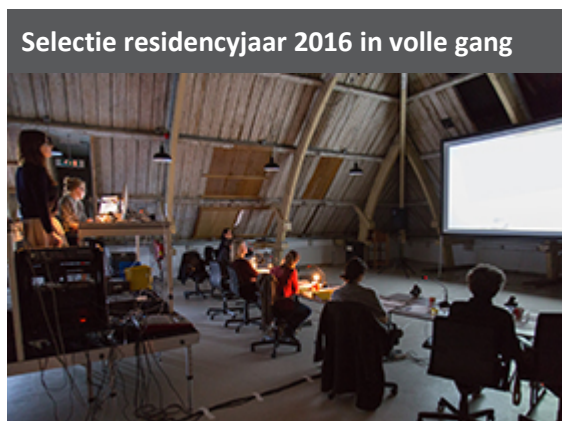
Selectie residencyjaar 2016 in volle gang

Twee keer per jaar zijn er Interne Open Studio's . Residents, advisors en staff kunnen zien waaraan door de verschillende residents wordt gewerkt; onderlinge contacten worden verdiept en inhoudelijke discussie versterkt.