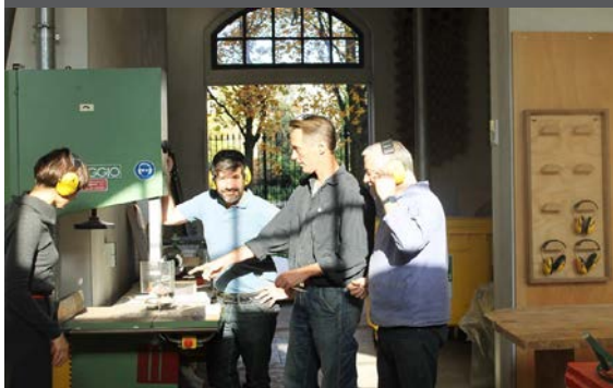
Mertens Frames in de houtwerkplaats

Mertens Frames biedt haar expertise aan de Rijksakademie in de vorm van ondersteuning in de houtwerkplaats en de ontwikkeling van een workshop 'lijsten maken' in 2016. Bij Mertens Frames staat kwaliteit van inlijsten en presenteren voorop. Met dit partnership wordt een nieuwe technische specialisatie toegevoegd aan het technische aanbod van de Rijksakademie en wordt bijgedragen aan de kwaliteit van werk en presenteren. Het bedrijf kenmerkt zich door vakmanschap van inlijsten en hoge kwaliteitseisen aan materialen en afwerking.