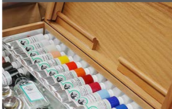
Old Holland Classic Colours

Alweer voor het vijfde jaar op rij heeft Old Holland Classic Colours alle schilders op de Rijksakademie een koffer met acryl en olieverf cadeau gedaan. De ambachtelijke ervaring van het bedrijf, de technologische kennis en raadpleging van kunstenaars wereldwijd resulteren in een reeks kunstenaarsverven van de hoogste kwaliteit. Rijksakademie kunstenaars kunnen na hun verblijf tegen een gereduceerd tarief gebruik blijven maken van Old Holland producten.