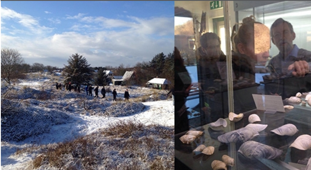
(Cultuur)historische wandeling en bezoek aan het schelpenmuseum

Aan de start van het Rijksakademie residency jaar zijn resident kunstenaars, advisors en medewerkers voor een kennismakingsreis naar Schiermonnikoog vertrokken.