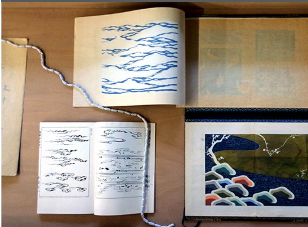
Researching the library: Japanse patroonboeken met houtsneden