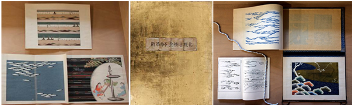
Close-up vitrine presentaties in 2014 en 2015